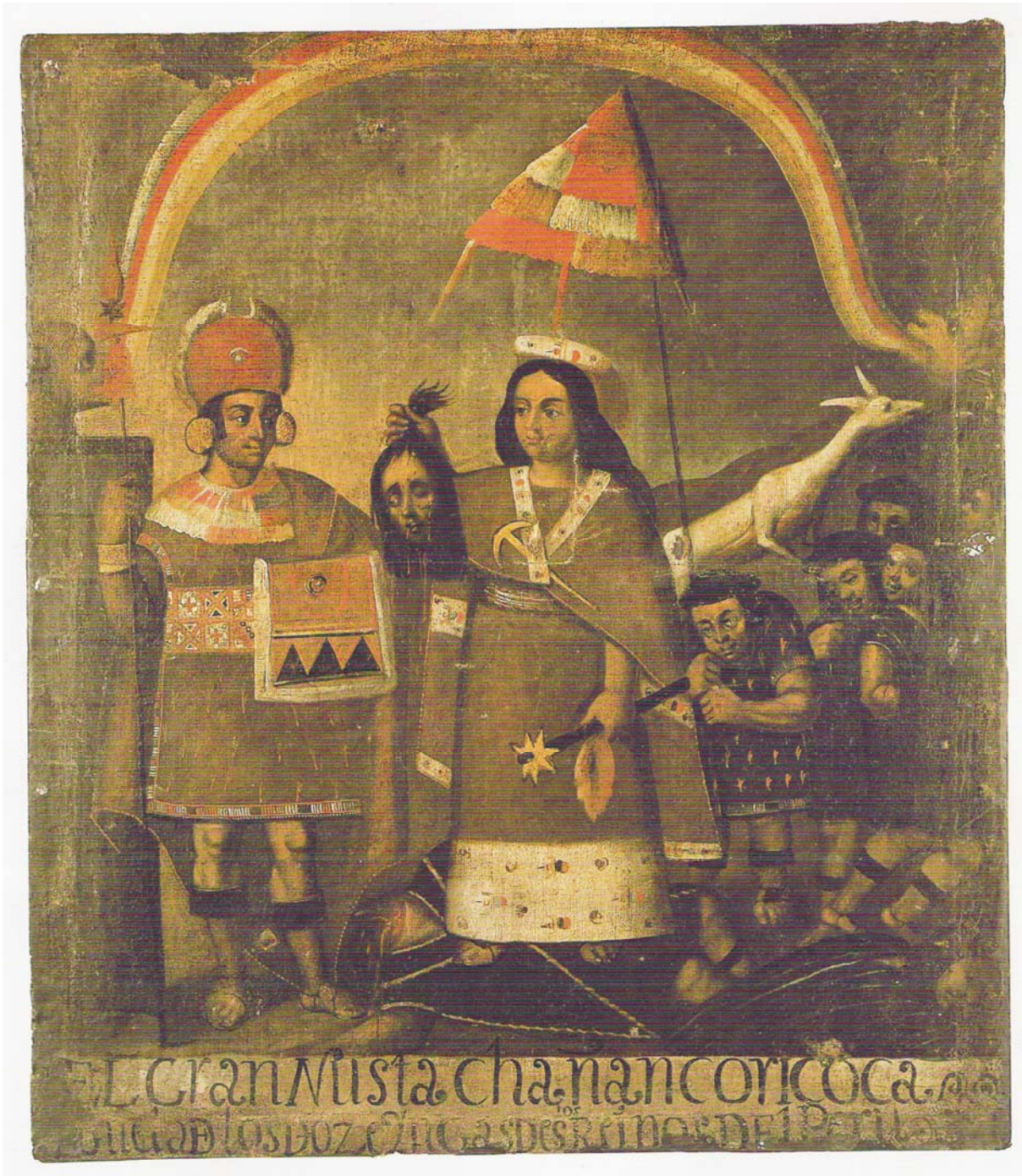
Imagem: Pintura sobre tecido. Museu Arqueológico de la Universidad Nacional San Antonio de Abad del Cusco – Cusco. Tela com 78 cms de altura e 65 cms de largura. Escola de Cuzco, período colonial, século XVI].